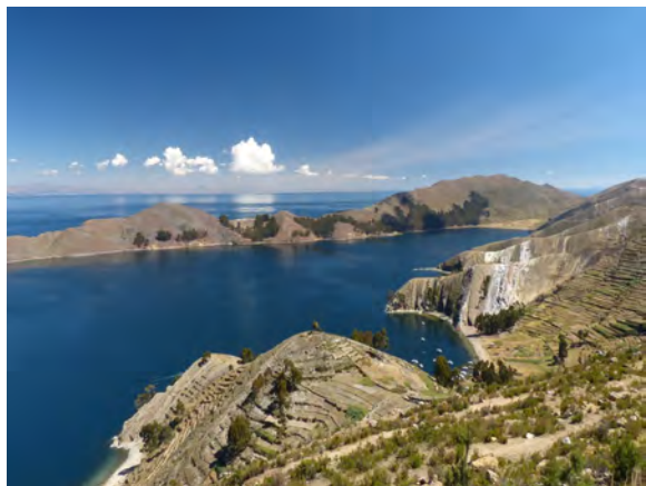
Titicacasee, Peru und Bolivien