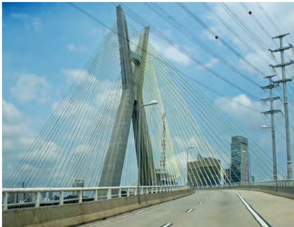
Octávio Frias de Oliveira-Brücke, Brasilien