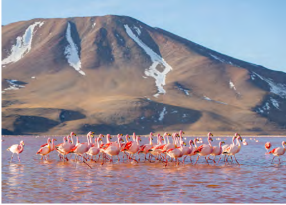
Laguna Colorada, Bolivien