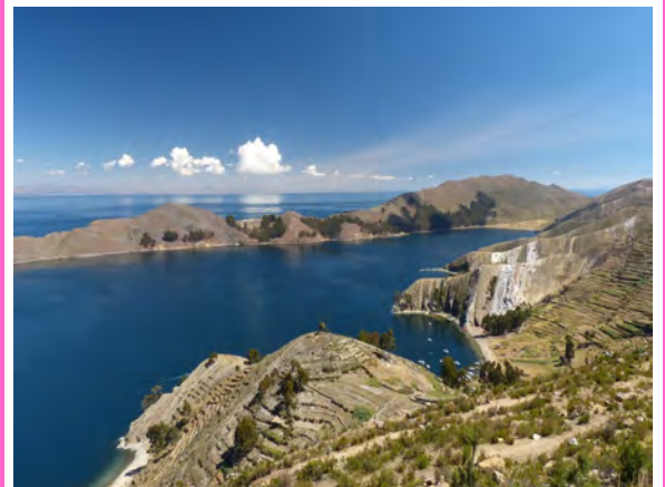
Titicacasee, Peru und Bolivien