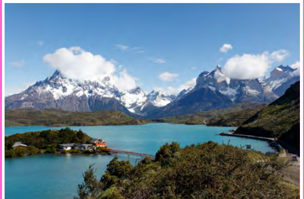
Patagonien, Argentinien und Chile