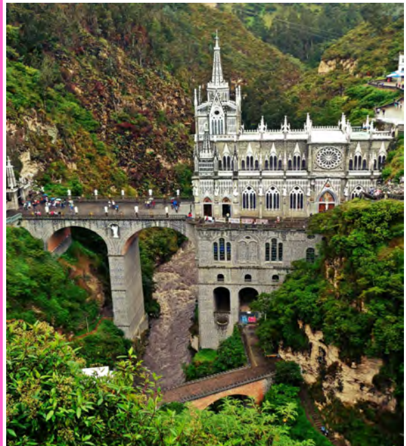
Santuario de Las Lajas, Kolumbien