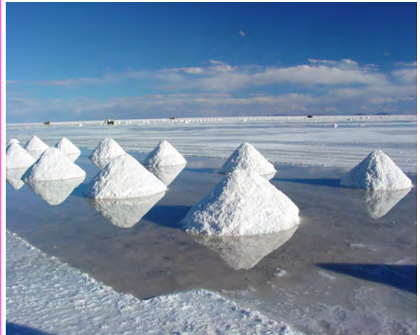
Salar de Uyuni, Bolivien