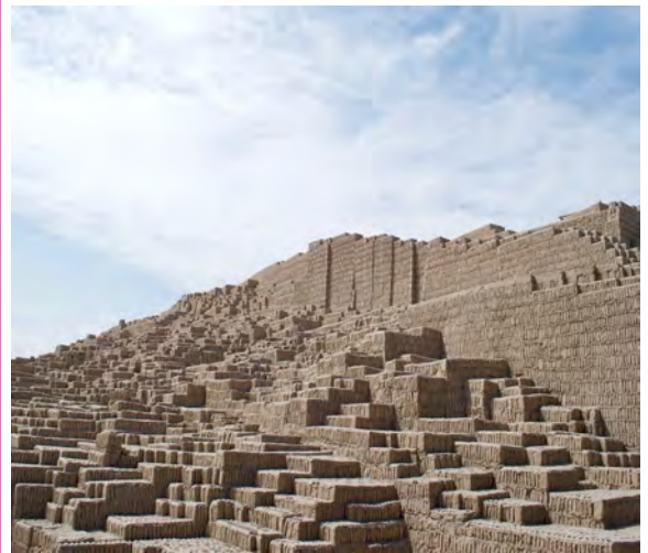
Huaca Pucllana, Peru