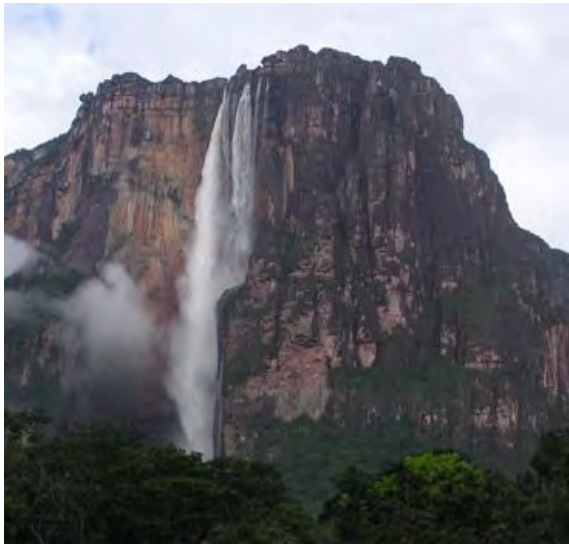
Salto Ángel, Venezuela