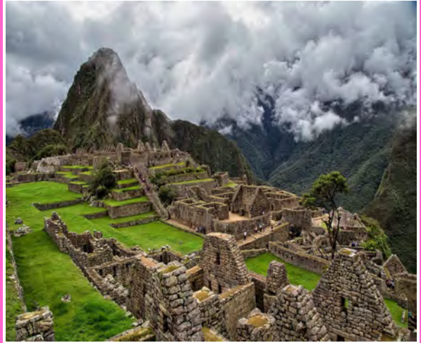
Machu Picchu, Peru