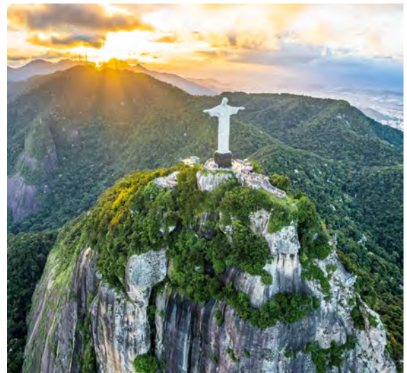
Cristo Redentor, Brasilien