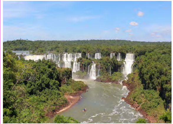
Iguazú-Wasserfälle, Brasilien und Argentinien