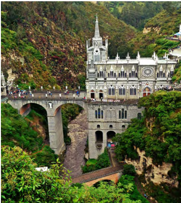
Santuario de Las Lajas, Kolumbien