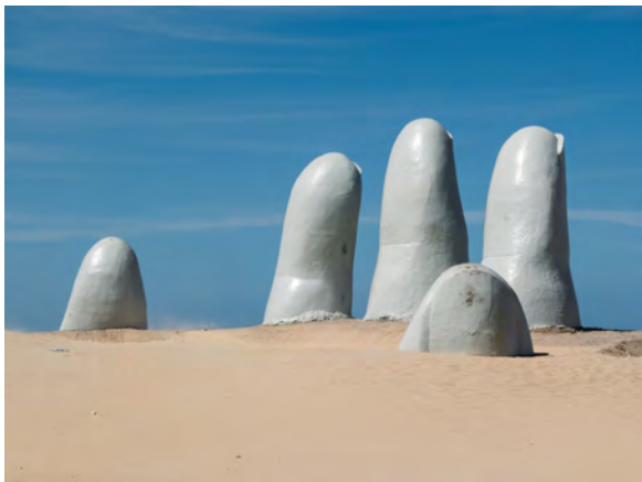
La Mano, Uruguay